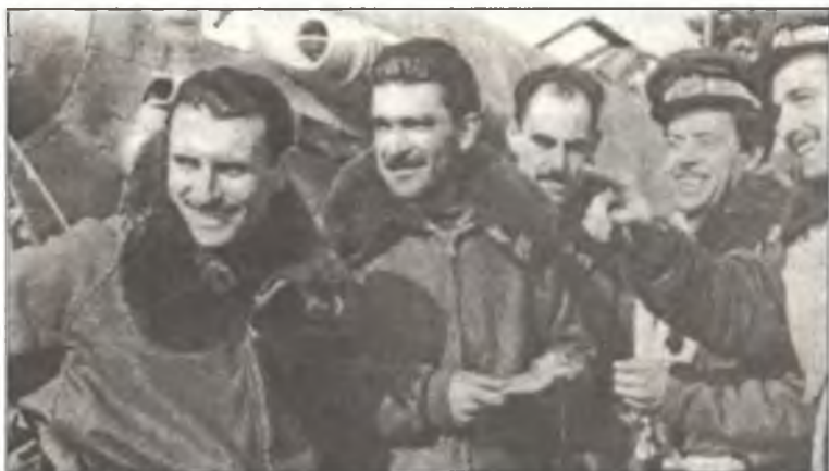
Пилоты 1° Squadr. 1° Gr. ANR, весна 1944 г.