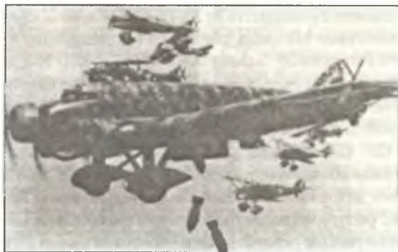
Бомбардировщик SM.81, летающий в сопровождении истребителей CR.32, сбрасывает бомбы на позиции республиканцев