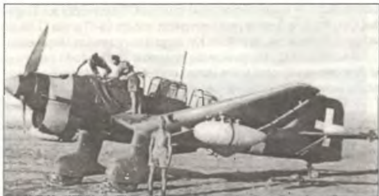
Ju-87R-2 из 239° Squadr. 96° Gr.Aut. В.а.Т., Ливия, июнь 1941 г.