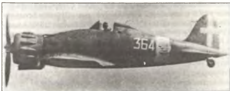
Истребитель С.200 из 364° Squadr. 150° Gr.Aut. С.Т., лето 1941 г.

Самолет уже имеет открытую кабину и неубирающееся хвостовое колесо