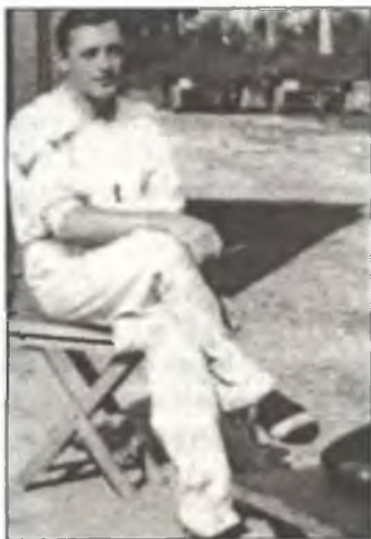
Марешалло Арольдо Соффритти (Aroldo Soffritti)