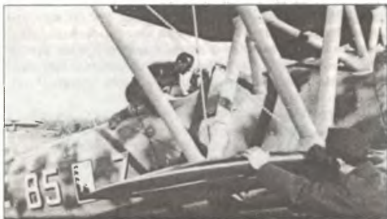
Истребитель CR.42 «85 – 7» тененте Джулио Чезаре Джунтеллы (Giulio Cesare Giuntella) из 85° Squadr. 18° Gr. С.Т., аэродром Урсел, октябрь — ноябрь 1940 г.