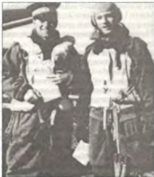
Экипаж Ju-87D из 102° Gr. Aut. В.а.Т. после успешного налета на конвой «Пьедестал»