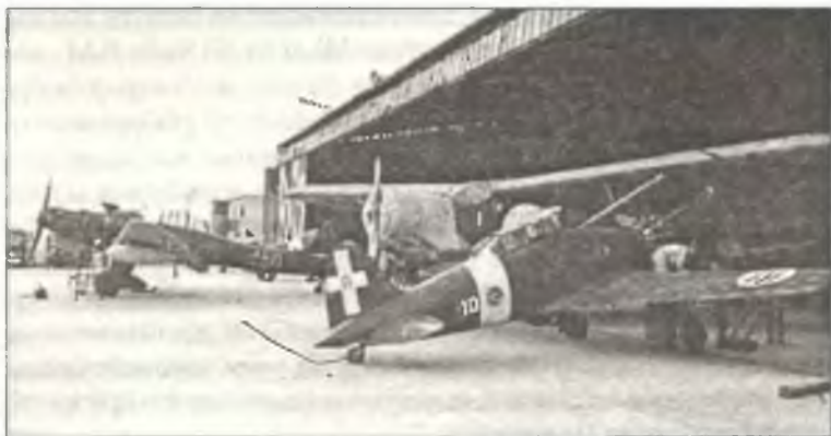
На переднем плане — С.200 из 86° Squadr. 7° Gr. 54° Stormo C.T., за ним — связной Ca.113, далее — Ju-87R из StG3, Сицилия, июнь 1941 г.