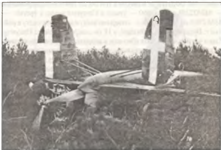
Бомбардировщик BR.20M MM22621 из 243° Squadr. 99° Gr. В.Т., сбитый 11.11.1940 г. во время налета на Харидж и совершивший вынужденную посадку в районе г. Вудбридж, в 11 км северо-восточнее Ипсуича