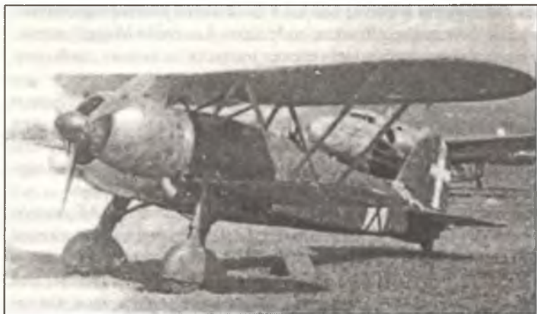
CR.42 из 413° Squadr. Aut. С.Т., Эфиопия, лето 1940 г. На фюзеляже самолета видна эмблема — черный крест Св.Андрея на белом квадрате