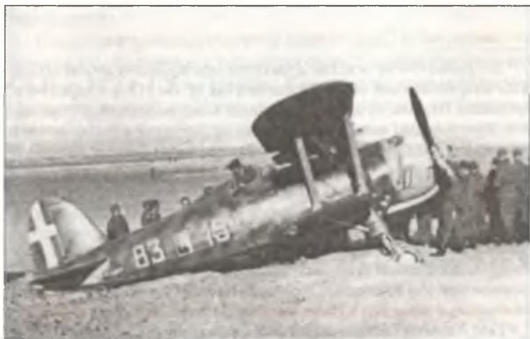
CR.42 «83 – 15» из 83° Squadr. 18° Gr. С.Т., совершивший посадку на побережье Бельгии