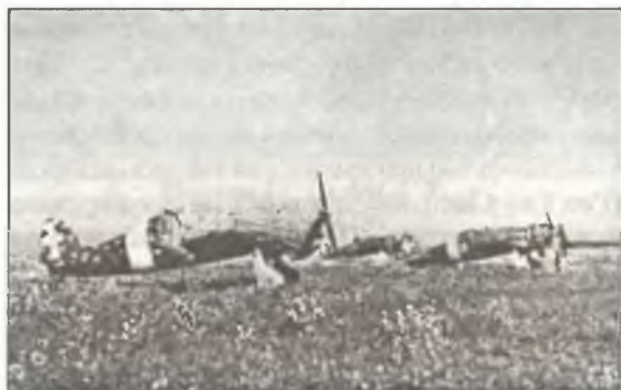
Истребители С.200 из 382° Squadr. 21° Gr.Aut. С.Т., аэродром Сталино, конец мая 1942 г.