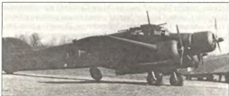
Торпедоносец SM.79 «В1 – 09» из группы «Бускалья», аэродром Лонате-Поццоло, 1944 г.