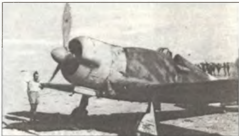
Истребитель G.50bis из 20° Gr.Aut. С.Т., Ливия, весна 1941 г.