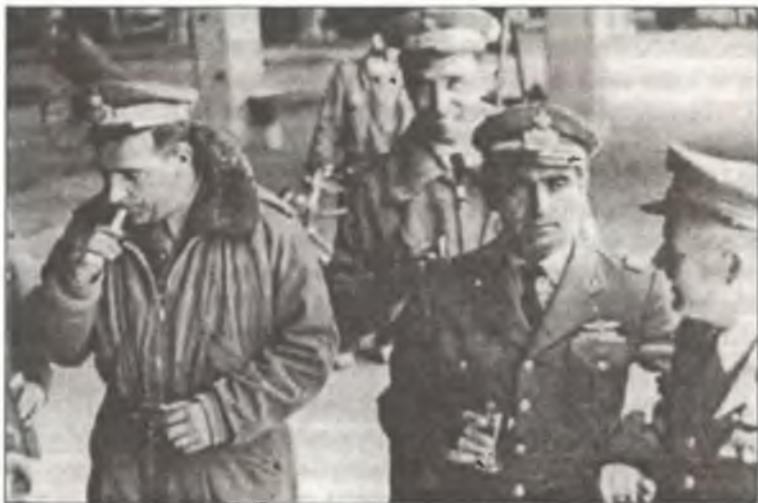
Капитано Макс Пероли (крайний слева) после налета на Порт-Судан, май 1943 г.

Во время полета выяснилось, что двигатели «I-BUBA» расходуют слишком много топлива и его не хватит на обратную дорогу. Поэтому Пероли сбросил свои бомбы на Порт-Судан, после чего повернул обратно. Самолет маджоре Виллы достиг Гурэ, и в результате бомбежки на аэродроме возник крупный пожар. Проведя в воздухе соответственно 23 и 24 часа, оба итальянских самолета благополучно вернулись на о. Родос.