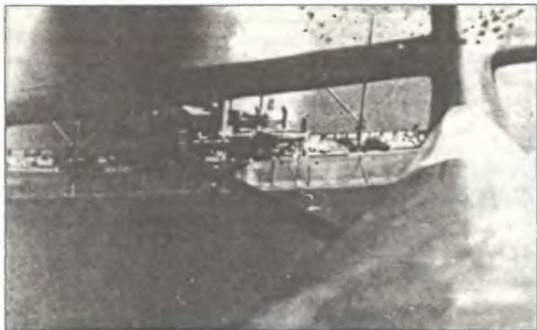
Ju-87R-2 из 239° Squadr. 96° Gr.Aut. В.а.Т. выходит из атаки английского транспорта у побережья Ливии, июнь 1941 г.