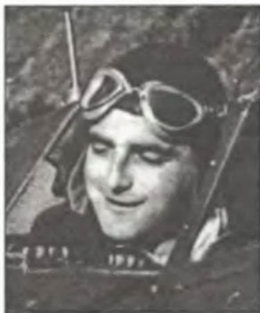
Маршиалло Пьетро Бьянчи (Pietro Bianchi)