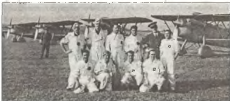
Итальянская пилотажная группа на международном авиационном слете, Будапешт, 20.06.1937 г.