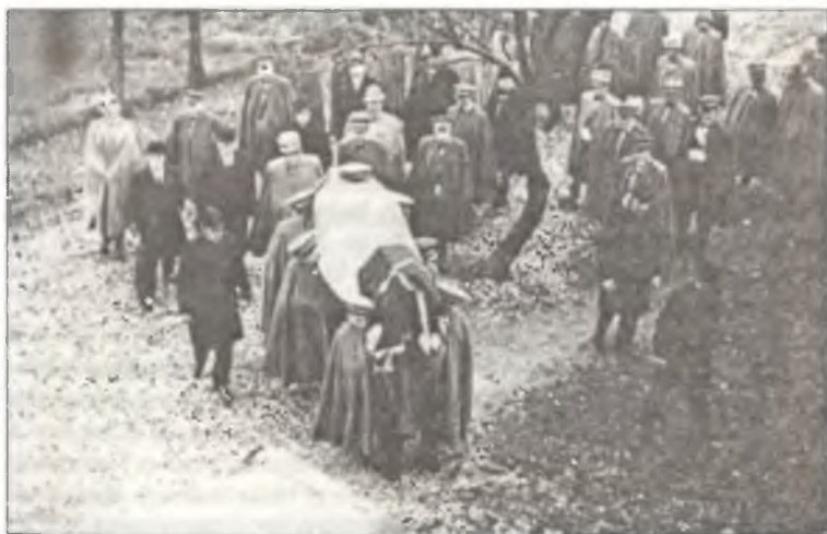
Похороны погибшего пилота из 4° Stormo С.Т. На аэродромах Кампоформидо и Гориция, на которых базировался 4° Stormo С.Т., происходило в среднем по одной аварии в неделю, а весной, когда интенсивность полетов увеличивалась, аварии случались еще чаще