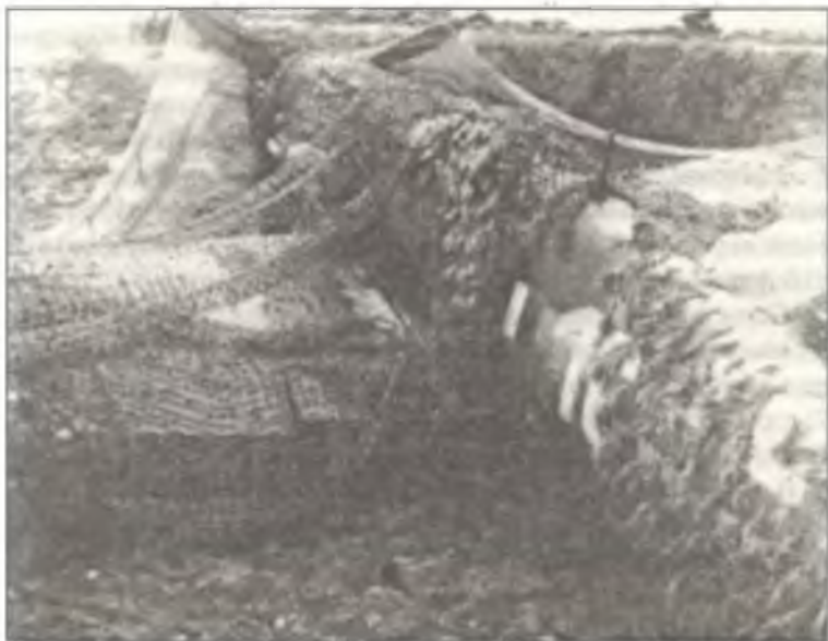
Замаскированный Bf-109G-6 из 2° Squadr. II° Gr. С.Т., аэродром Авиано, февраль 1945 г.