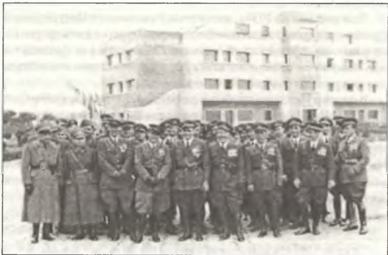
Экипажи бомбардировщиков после возвращения в Италию, Болонья, весна 1939 г.