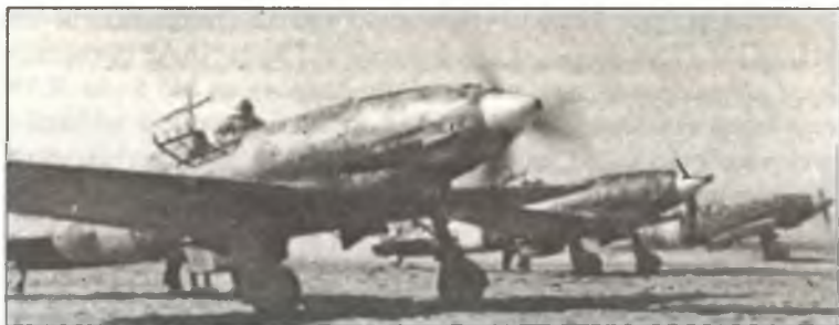
Истребители С.202 из 3° Stormo С.Т., аэродром Таурога (Tauroga), начало января 1943 г.