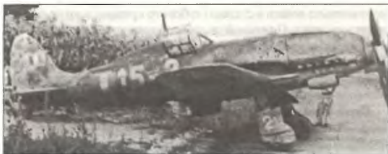
Истребитель C.205 из 2° Squadr. 1° Gr. С.Т., полевой аэродром около Виченцы, июль 1944 г.