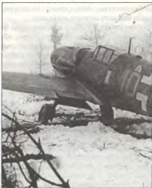
Bf-109G-6 из 1° Squadr. II° Gr. С.Т., аэродром Геди, в 57 км западнее Вероны, конец ноября 1944 г.