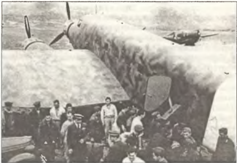
Транспортный самолет S.A.S., прилетевший с Сицилии в Тунис