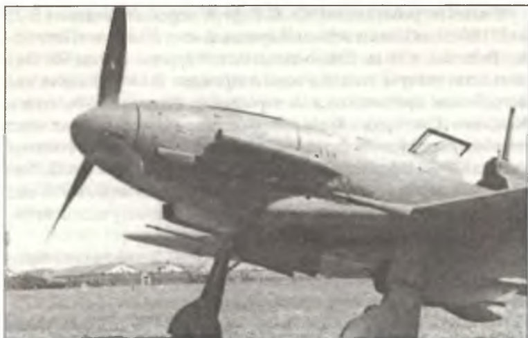
G.55 из 1° Squadr. II° Gr. С.Т., аэродром Кашина-Ваджа, июнь 1944 г. На капоте двигателя — эмблема «Gigi Tre Osel», которая ранее была эмблемой 150° Gr.Aut. С.Т. Реджиа Аэронаутики