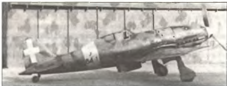
Истребитель С.202 MM7720 «84 – 1» командира 84° Squadr. 10° Gr. 4° Stormo С.Т. капитано Франко Луччини