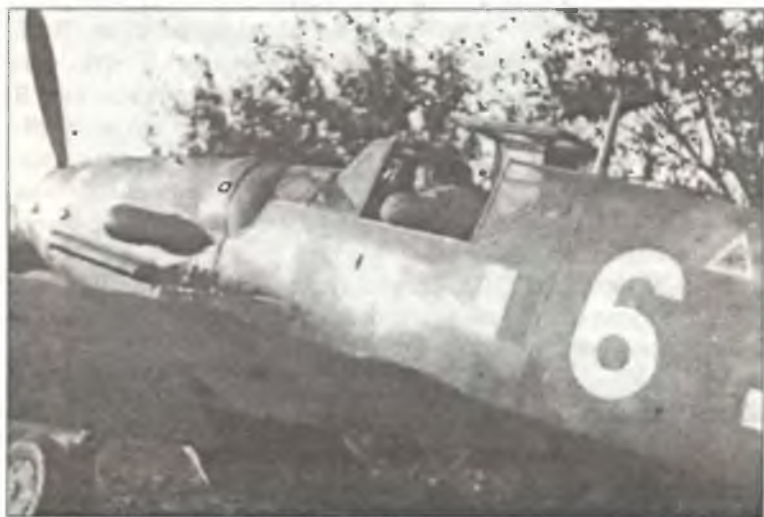
Bf-109G-6 из 3° Squadr. II° Gr. С.Т., ноябрь 1944 г.