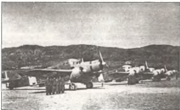
Торпедоносцы SM.79 из 281° Squadr. A.S., о. Родос, март 1941 г. Носовая часть самолетов окрашена в серый цвет, чтобы «теряться» на фоне неба и моря во время выхода в атаку