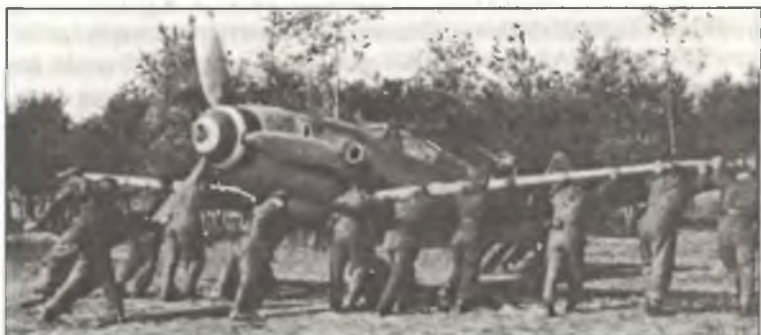
Механики закатывают на стоянку Bf-109G-10/AS из I° Gr. С.Т.