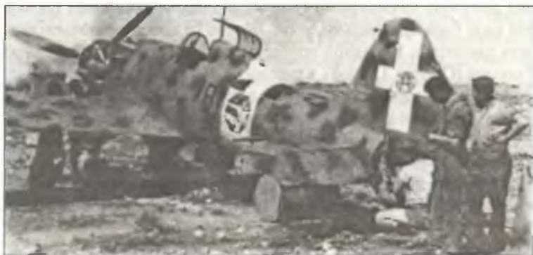
Механики ремонтируют С.202 из 81° Squadr. 6° Gr. 1° Stormo С.Т., Ливия, 1942 г.