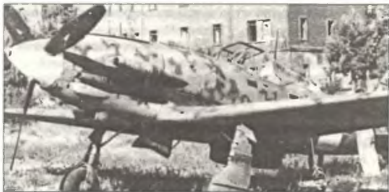
Истребитель С.202 из 359° Squadr. 22° Gr.Aut. С.Т., аэродром Каподичино около Неаполя, лето 1943 г.