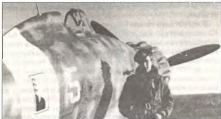
Сержете Горрини около своего С.200 «85-5», аэродром Чампино, лето 1941 г.