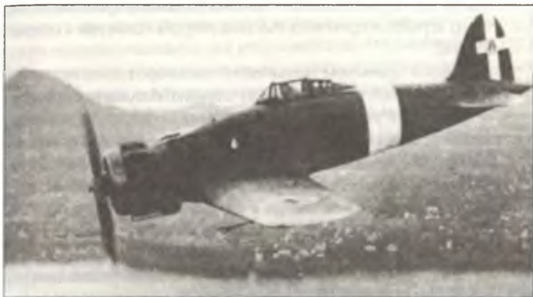
Истребитель С.200 первой серии с закрытой кабиной и убирающимся хвостовым колесом