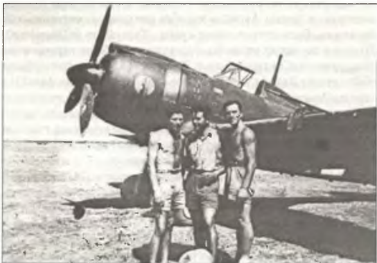
Пилоты 5° Stormo Assalto, Южная Италия, лето 1943 г.