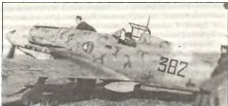
Истребитель С.202 командира 382° Squadr. 21° Gr.Aut. С.Т. капитано Энрико Кандио, аэродром Сталино, сентябрь 1942 г.