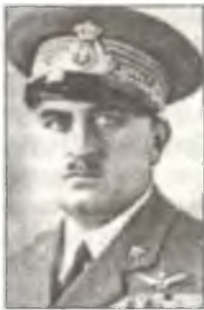
Генерал Джузеппе Валье, занимавший в 1933 — 39 гг. посты начальника Генерального штаба Реджиа Аэронаутики и заместителя министра авиации