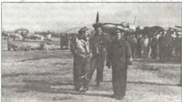
Итальянские пилоты на аэродроме Тирана, апрель 1941 г.