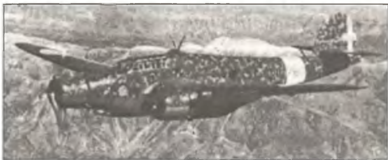
Бомбардировщик Cant Z.1007bis из 210° Squadr. 50° Gr.Aut. В.Т. в ходе боевого вылета над Грецией, ноябрь 1940 г.