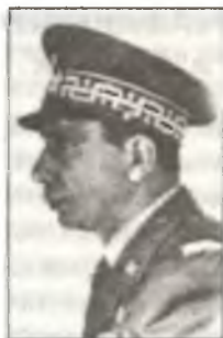
Генерал Амедео Мекоцци