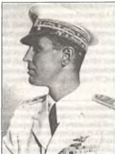
Вице-король Итальянской Восточной Африки генерале-армата аэреа Амедео ди Савойя герцог Д'Аоста