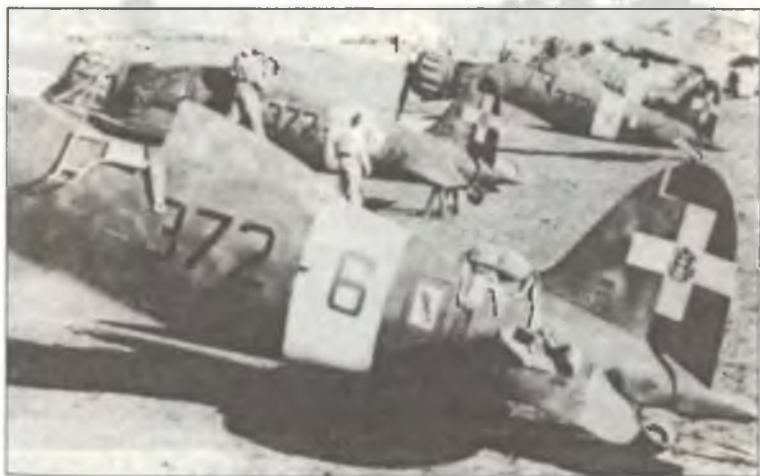
Истребители С.200 из 372° Squadr. 153° Gr. С.Т., Ливия, весна 1941 г.