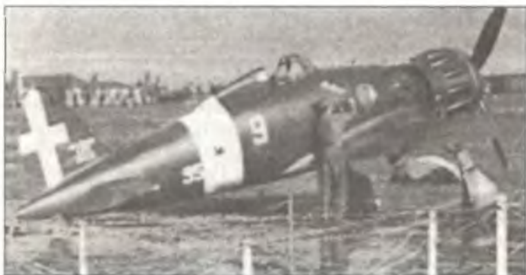
Истребитель C.200 «95 – 9» тененте Франко Бордони Бислери, аэродром Афины, октябрь 1941 г. На фюзеляже под кабиной пилота видна надпись «Robur»