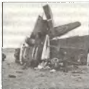
Пилоты 1° Squadr. С.Т. позируют около сбитого бомбардировщика «Потез-540» №4219 «F», 25.09.1936 г.