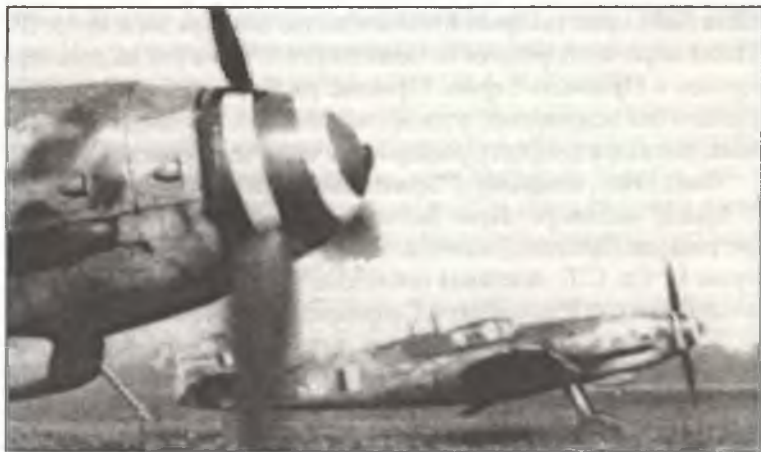
Истребители Bf-109G-10/AS из I° Gr. С.Т. перед взлетом, аэродром Мальпенса, весна 1945 г.