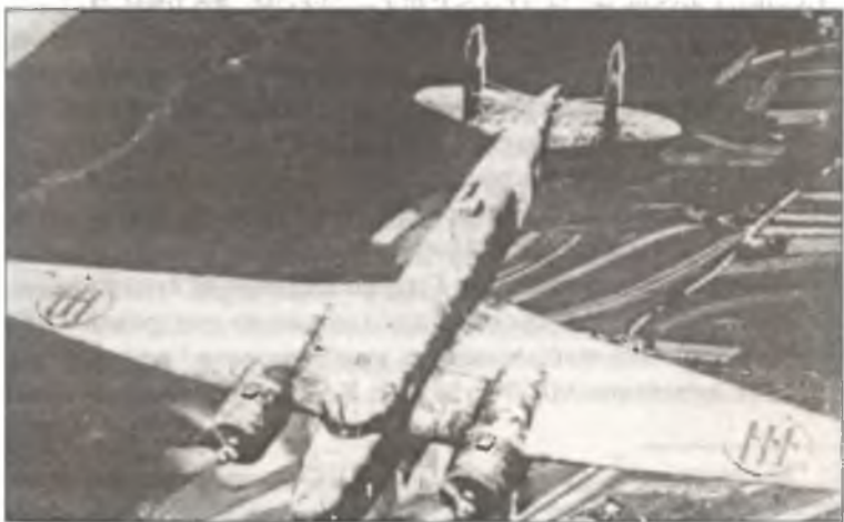
Бомбардировщик Fiat BR.20M над Албанией, осень 1940 г.