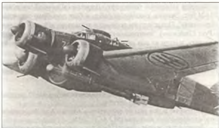
Торпедоносец SM.79 из 132° Gr. A.S.