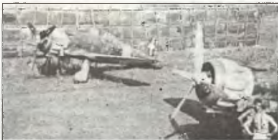
Истребители С.200 из 386° Squadr. 21° Gr.Aut. С.Т., лето 1942 г.