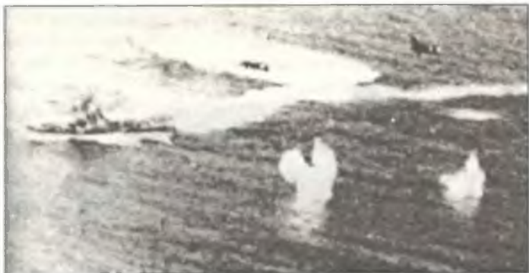
Ju-87R-2 из 239° Squadr. 96° Gr.Aut. В.а.Т. атакуют сторожевой корабль «Крикет» («Cricket»); Средиземное море у побережья Ливии, июнь 1941 г.