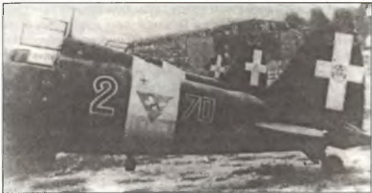
Истребитель С.202 из 70° Squadr. 23° Gr. 3° Stormo С.Т., аэродром Черветери, в 35 км северо-западнее Рима, август 1943 г.