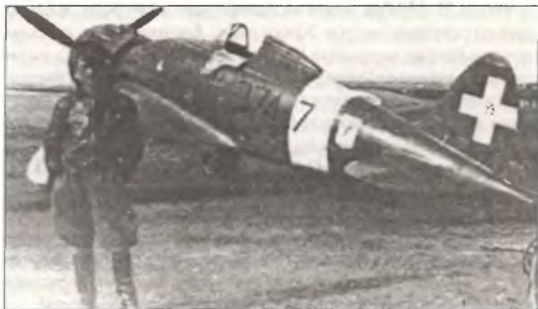
Пилот из 374° Squadr. 153° Gr.Aut. С.Т. около своего С.200, аэродром Гротталье, в 17 км северо-восточнее Таранто, конец 1940 г.