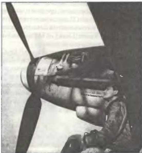
Пилот II° Gr. С.Т.