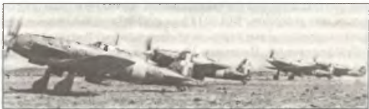
C.202 из 70° Squadr. 23° Gr. 3° Stormo C.T., аэродром Эль-Хамма, начало февраля 1943 г.