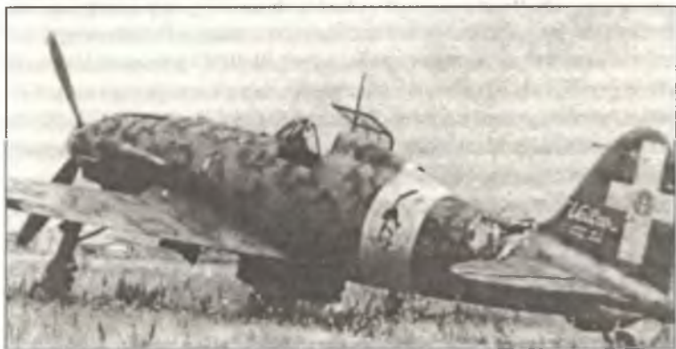
Истребитель С.205V из 360° Squadr. 155° Gr. 1° Stormo С.Т., аэродром Моисеррат, о. Сардиния, весна 1943 г.