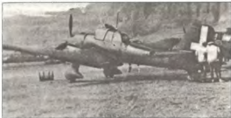
Ju-87B из 96° Gr.Aut. В.а.Т., Сицилия, сентябрь 1940 г.