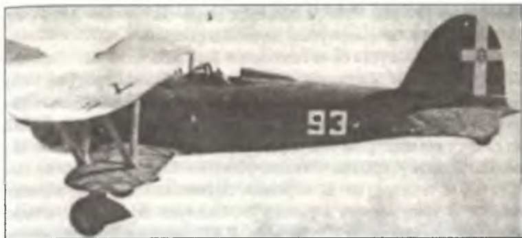
Истребитель CR.42 из 93° Squadr. 8° Gr. 2° Stormo C.T., Ливия, лето 1940 г.