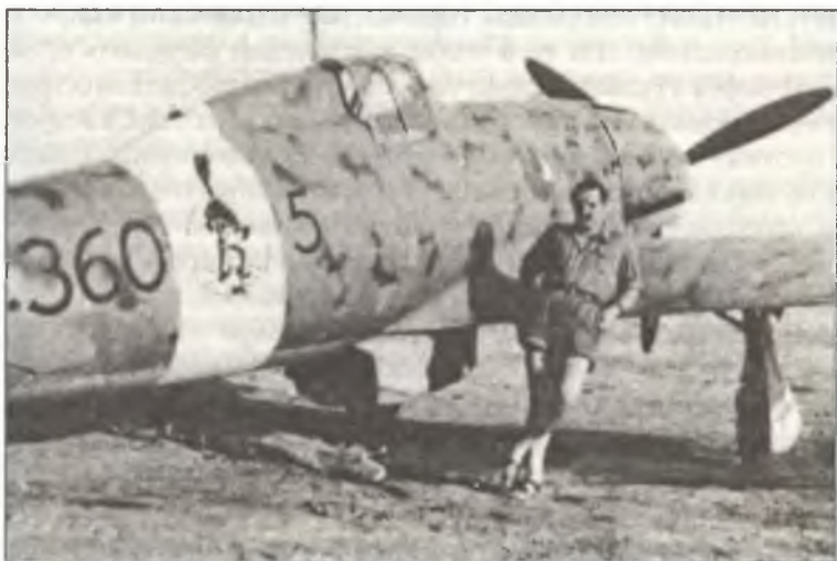
Марешалло Паскуале Бартолуччи (Pasquale Bartolucci) из 360° Squadr. 155° Gr. 51° Stormo С.Т., Сицилия, лето 1942 г. В ходе Второй мировой войны он одержал четыре личных победы и две победы в группе