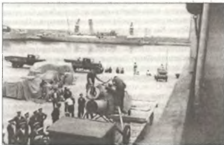
Перегрузка разобранных истребителей CR.32 с борта корабля на грузовики