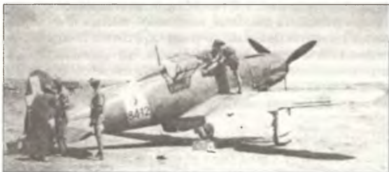
С.202 MM7919 «84 – 12» из 84° Squadr. 10° Gr. 4° Stormo С.Т., аэродром Фука, 24.10.1942 г.