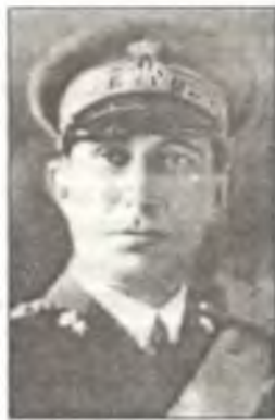
Первый начальник Генерального штаба Реджии Аэронаутики генерал Пьер Руджеро Пиччио