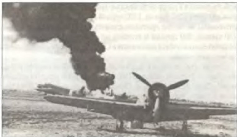
Итальянский аэродром после налета P-40, на заднем плане — горящий SM.82, Тунис, весна 1943 г.