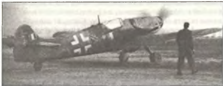
Bf-109G-14 W.Nr.43444 командира II° Gr. С.Т. маджоре Карло Мани, аэродром Авиано, февраль 1945 г. Истребитель имеет обозначения командира группы, принятые в Люфтваффе