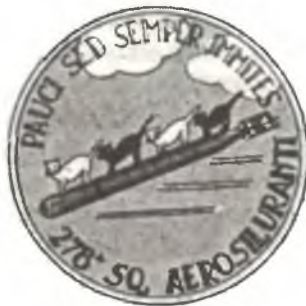
Эмблема 278° Squadr. A.S.