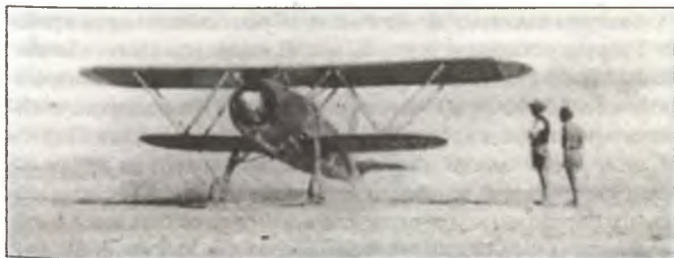
Истребители CR.42 из 96° Squadr. 9° Gr. 4° Stormo C.T., аэродром Эль-Адем, лето 1940 г.