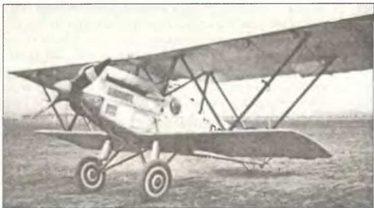
Истребитель Fiat CR.20 из 90° Squadr. 10° Gr. 4° Stormo C.T., аэродром Кампоформидо, в 90 км северо-восточнее Венеции