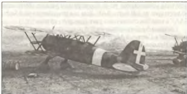
CR.42 из 54° Squadr. 47° Gr. Assalto, аэродром Зуара, январь 1943 г.