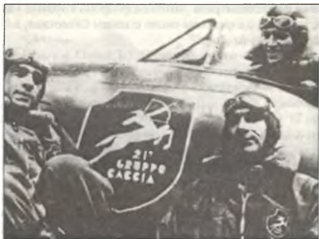
Пилоты 21° Gr.Aut. С.Т., осень 1942 г.