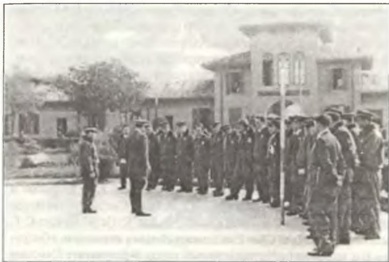
Пилоты 9° Gr. 4° Stormo С.Т. перед отлетом на Сицилию, аэродром Гориция, 27.09.1941 г.