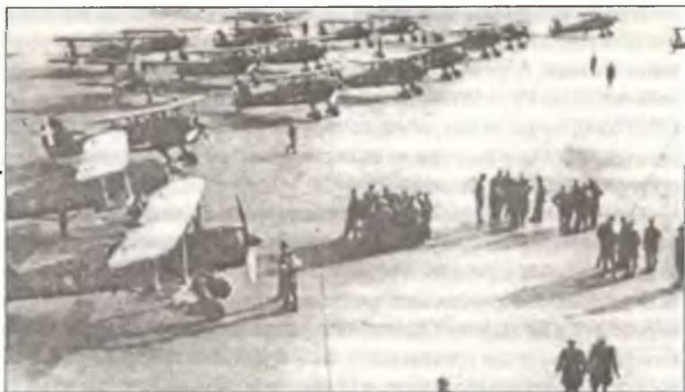
Истребители CR.42 из 18° Gr. С.Т., аэродром Урсел, октябрь — ноябрь 1940 г.