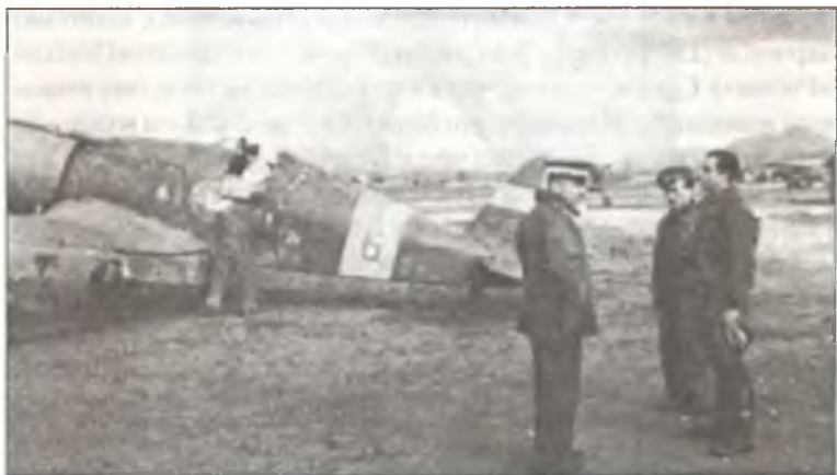
Пилоты из 154° Gr. Aut. С.Т., аэродром Деволи, апрель 1941 г.