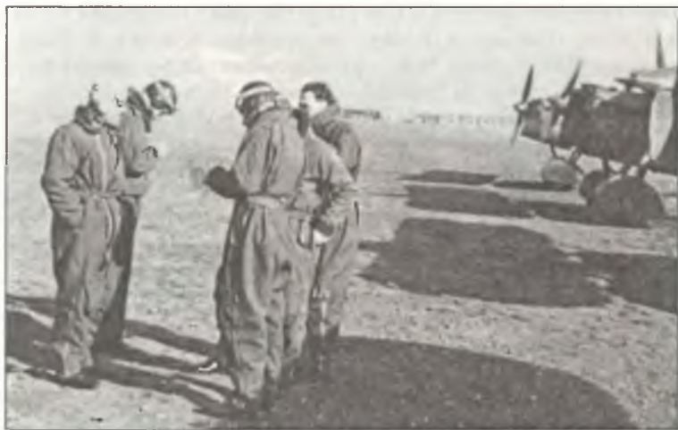
Инструктаж пилотов перед полетом на истребителях CR.32, аэродром Горичия, 1936 г.