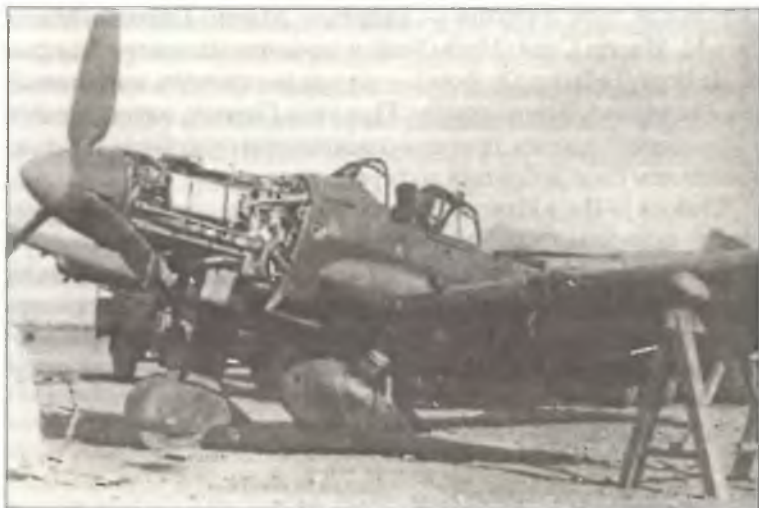
Поврежденный Ju-87D-3 из 237° Squadr. В.а.Т., оставленный на аэродроме Палермо, Сицилия, июль 1943 г.