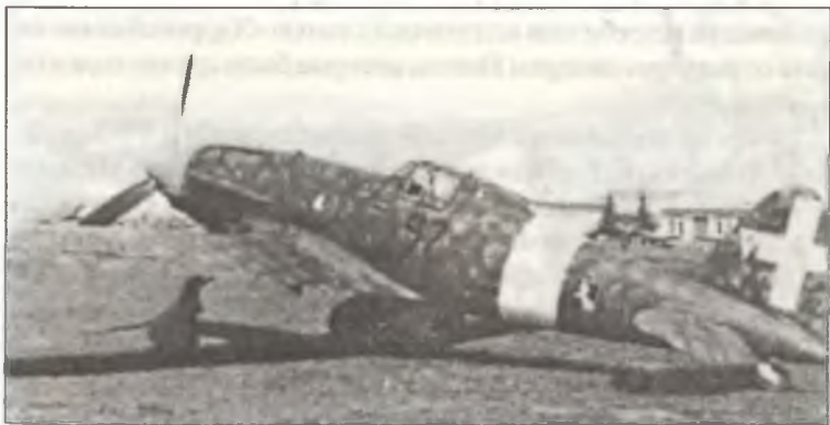
С.202 MM7735 «97 – 5» из 97° Squadr. 9° Gr. 4° Stormo С.Т., Сицилия, конец сентября 1941 г.