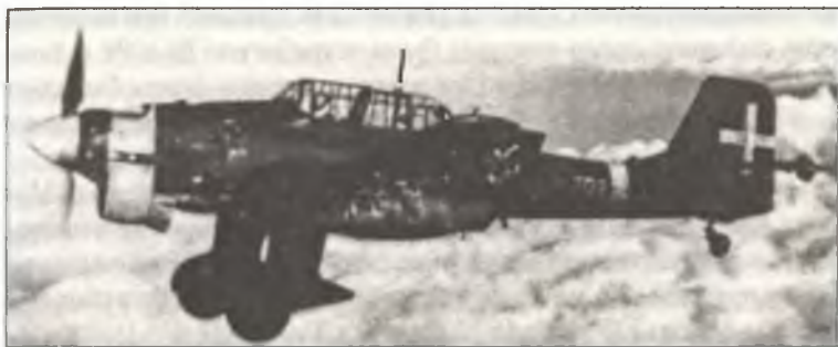
Ju-87R-2 из 208° Squadr. 101° Gr. В.а.Т. в ходе боевого вылета над Югославией, апрель 1941 г.