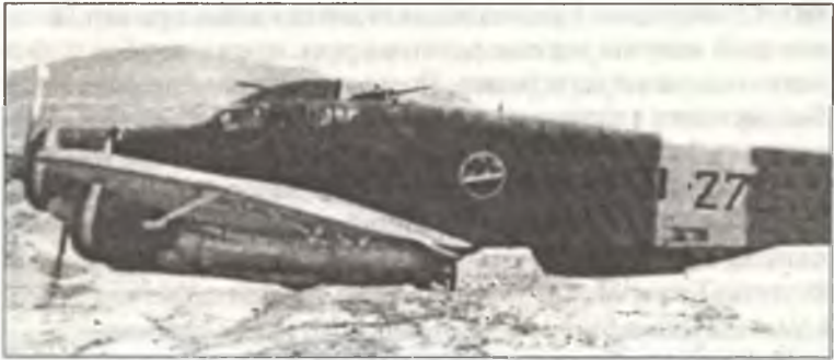
Торпедоносец SM.79 из 278° Squadr. A.S., сентябрь 1940 г.