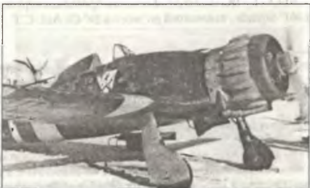
С.200 из 22° Gr.Aut. С.Т., аэродром Запорожье, зима 1941 — 42 г.