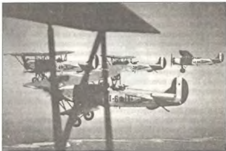
Самолеты-разведчики Ro.1 из 41° Squadr. R.T., 16.04.1934 г.