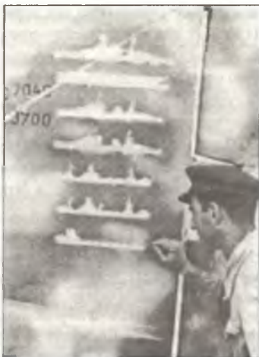
Силуэты атакованных кораблей, нарисованные на киле торпедоносца SM.79