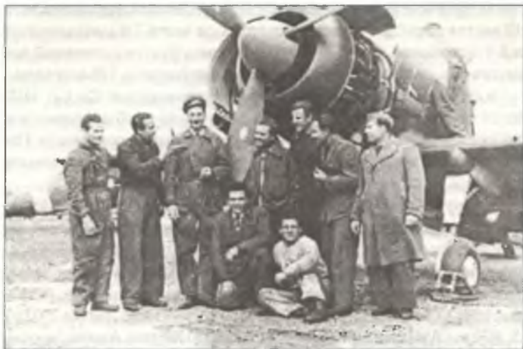
Пилоты 239° Squadr. 102° Gr. 5° Stormo Assalto, аэродром Лонате-Поццоло, в 37 км северо-западнее Милана, апрель 1943 г.