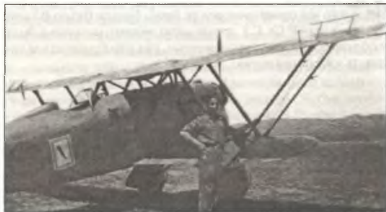
Истребитель CR.32 из VI° Gr. C.T., 1937 г.