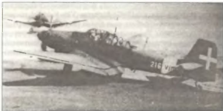
Ju-87D-3 из 216° Squadr. 121° Gr.Aut. В.а.Т., аэродром Неаполь, август 1943 г.