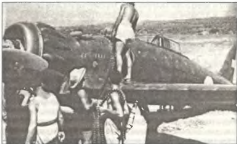
Подготовка к вылету истребителя С.200 из 88° Squadr.