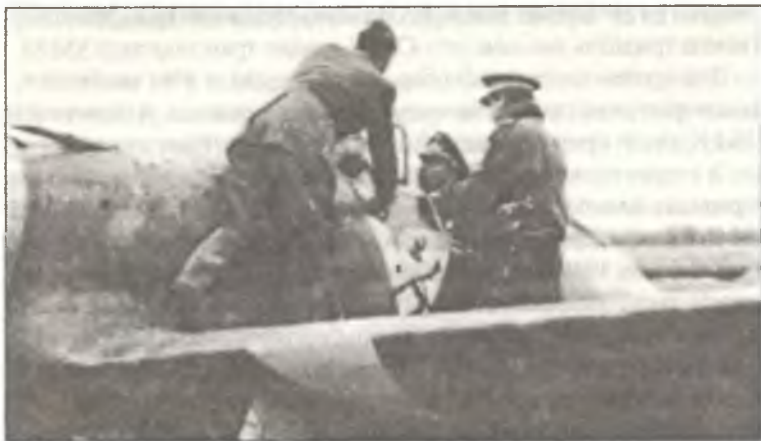
Инспектор истребительной авиации Люфтваффе оберст Вернер Мёльдерс (Werner Mölders) в кабине С.200 из 22° Gr.Aut. С.Т., сентябрь — октябрь 1941 г.