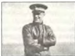
Маджиоре Марио Де Бернади, установивший 22.10.1927 г. и 30.03.1928 г. два абсолютных мировых рекорда скорости