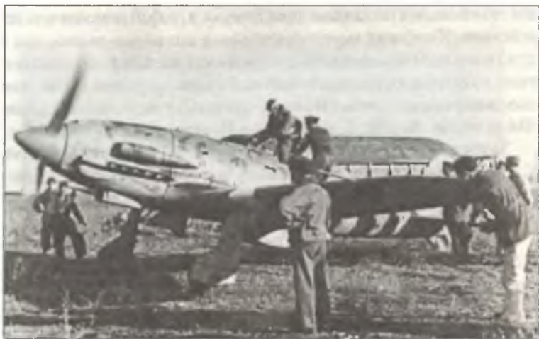
Пилот из 382° Squadr. 21° Gr.Aut. С.Т. после вылета на С.202, аэродром Ворошиловград, сентябрь 1942 г.