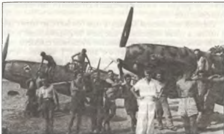
Пилоты и механики Реджиа Аэронаутики, аэродром Комизо, Сицилия, лето 1942 г. Итальянский С.202 (справа) и Вf-109F-4 из Stab/JG53