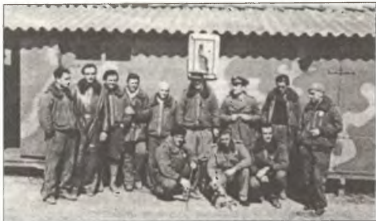
Пилоты из XXIII° Gr. C.T., 1937 г.