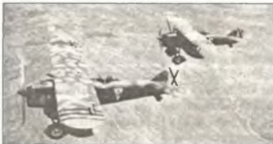
Истребители CR.32 в ходе патрульного полета над линией фронта