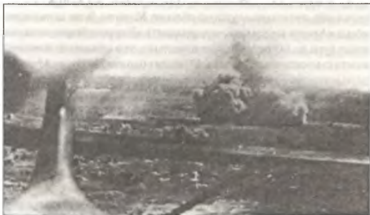
Снимок, сделанный бортстрелком Ju-87B из 96° Gr.Aut. В.а.Т., во время налета на аэродром Хал Фар, 15.09.1940 г.