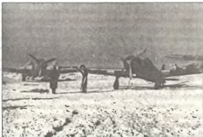
С.200 из 21° Gr.Aut. С.Т., зима 1942/43 г.

Собственные потери Реджиа Аэронаутики на Восточном фронте составили 66 самолетов, в т.ч. 21 самолет потеряло Aviazione del C.S.I.R. и 45 — C.A.F.O.