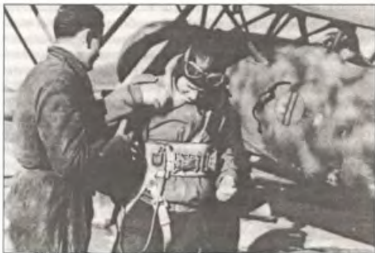
Пилот из 394° Squadr. 160° Gr.Aut. С.Т. перед вылетом, Албания, ноябрь 1940 г. На фюзеляже самолета нарисован профиль Муссолини