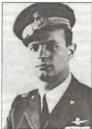
Карло Эмануэле Бускалья