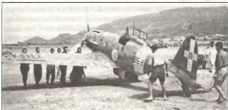
Механики закатывают на стоянку С.202 из 86° Squadr. 7° Gr. 54° Stormo С.Т., Пантеллерия, весна 1943 г.