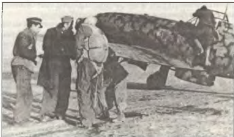
Механики помогают надеть парашют командиру 23° Gr. 3° Stormo С.Т. маджоре Луиджи Филиппи, аэродром Сфакс, конец января 1943 г.