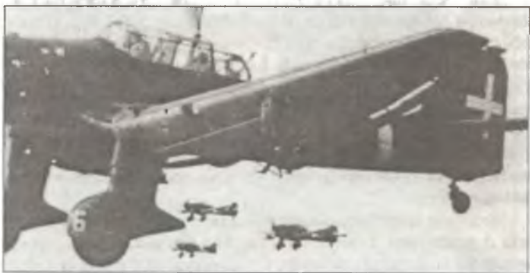
Ju-87R-2 из 239° Squadr. 96° Gr.Aut. В.а.Т. в ходе очередного налета на Тобрук, июнь 1941 г.