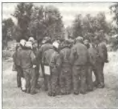
Пилоты 1° Гг. С.Т. перед вылетом, аэродром Торрихос, ноябрь 1936 г.