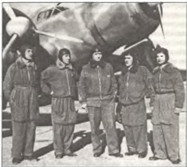
Командир 281° Squadr. A.S. капитано Карло Эмануэле Бускалья (в центре) со своим экипажем, аэродром Гадурра, о. Родос, март 1941 г.