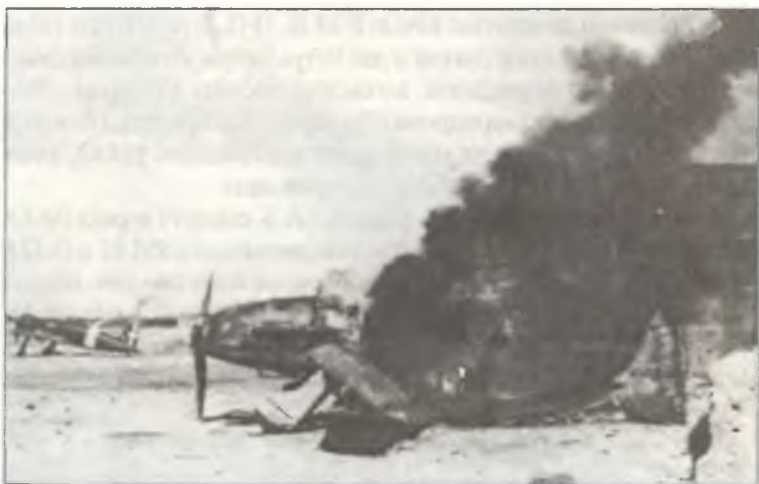
Истребитель S.202, уничтоженный в ходе налета самолетов союзников, Тунис, весна 1943 г.