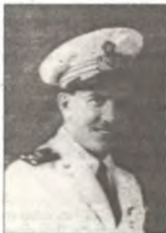
Капитано Коррадо Риччи (Corrado Ricci)