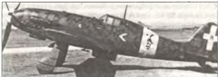
Истребитель C.202 MM9043 «151 – 1» командира 151° Squadr. 20° Gr. 51° Stormo C.T. капитано Никлота Доглио, аэродром Джела, Сицилия, июнь — июль 1942 г. На фюзеляже самолета — белый командирский шеврон, похожий на знак командира группы, использовавшийся в истребительной авиации Люфтваффе