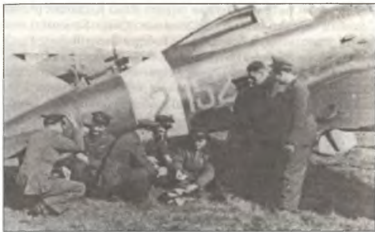
Пилоты 152° Squadr. 2° Gr.Aut. С.Т. около Re.2001 «152 – 2», Сицилия, весна 1942 г.