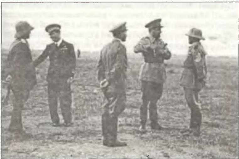
Губернатор Ливии маршал авиации Итало Бальбо (второй справа), аэродром Кастельбенито около Триполи