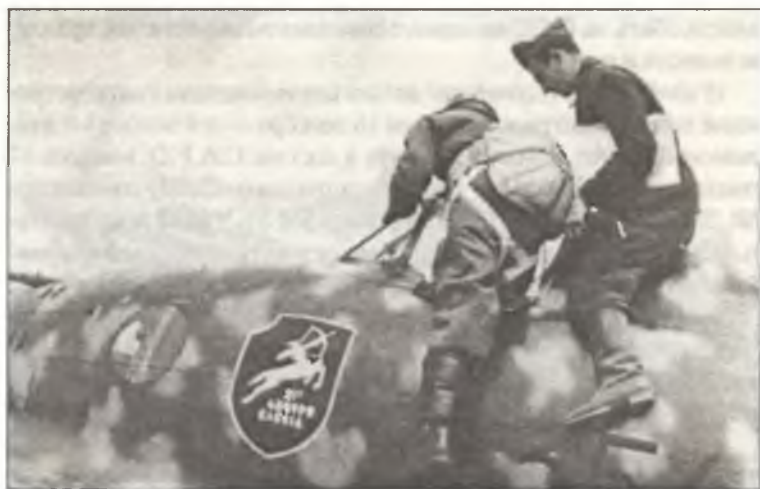
Пилот из 356° Squadra. 21° Gr.Aut. С.Т. садится в кабину С.200, осень 1942 г.