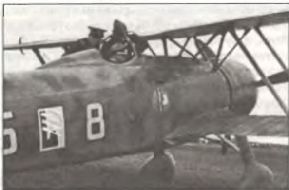
Летчик 85° Squadr. 18° Gr. С.Т. показывает свой CR.42 двум пилотам Люфтваффе, аэродром Урсел, октябрь — ноябрь 1940 г.