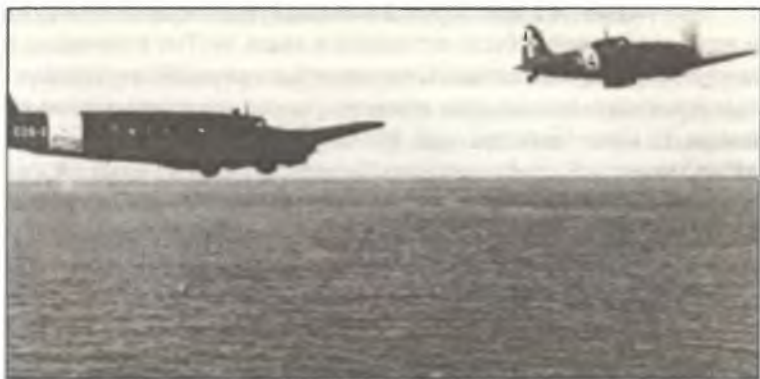
Транспортный Fiat G.12 из 608 o Squadr. S.A.S. в сопровождении истребителя C.202 летит на небольшой высоте над Тунисским проливом, весна 1943 г.