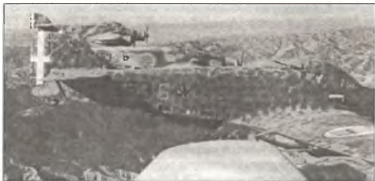
Бомбардировщики SM.79 из 253° Squadr. 104° Gr.Aut. В.Т. в ходе боевого вылета над Грецией