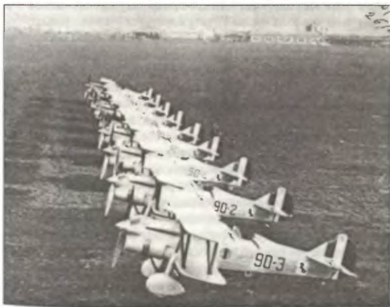
Истребители CR.32 из 90° Squadr. 10° Gr. 4° Stormo C.T., аэродром Горичия