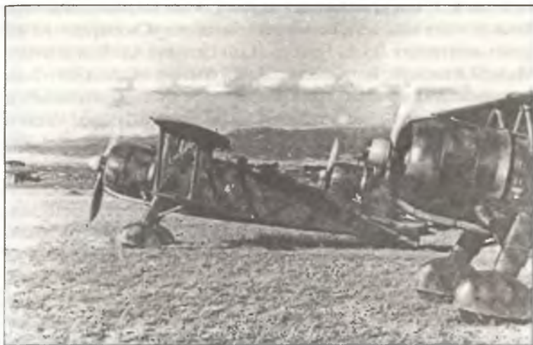
Истребители CR.42 перед боевым вылетом над Мальтой, Сицилия, лето 1940 г.