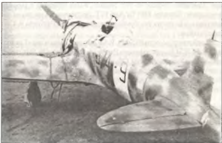
Истребитель С.200 «374 – 9» из 374° Squadr. 153° Gr.Aut. С.Т., аэродром Гротталье, конец 1940 г.