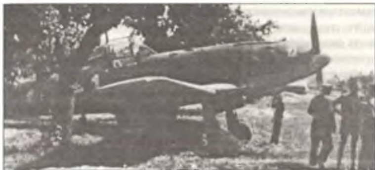
Истребитель G.55 из 1° Gr. С.Т., лето 1944 г.