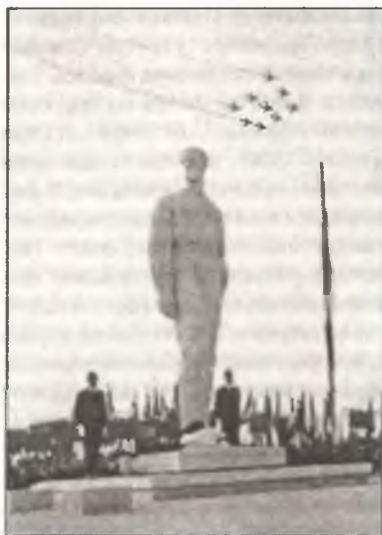
Открытие памятника Амедео ди Савойя герцогу Д'Аоста, аэродром Гориция, 04.11.1962 г.