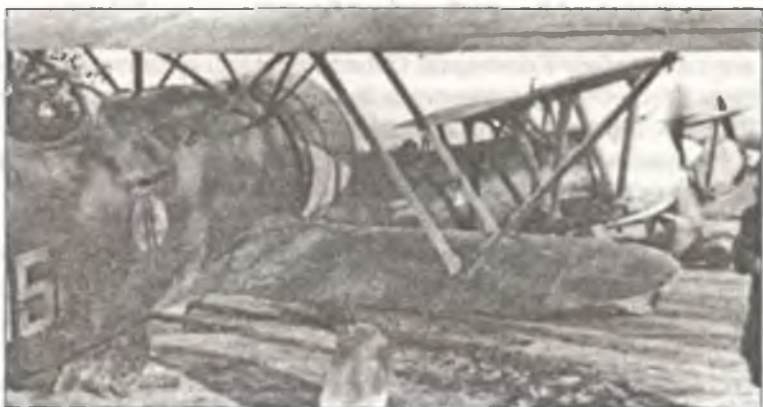
Истребители CR.42 из 18° Gr. С.Т., аэродром Урсел, осень 1940 г. На борту «Фиата» на втором плане нанесен специальный знак в форме вымпела, обозначающий, что самолет принадлежит командиру группы маджоре Ферруччио Восилле