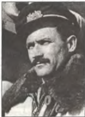
Марешалло Карло Магнаджи (Carlo Magnaghi), весна 1944 г.