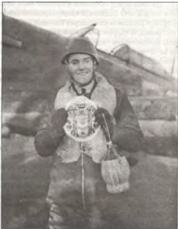
Пилот «Харрикейна» из 257 Sqdn. RAF в итальянской каске, с бутылкой кьянти и итальянским гербом, доставшимися ему в качестве трофеев с бомбардировщика BR.20M MM22621 из 243° Squadr. 99° Gr. В.Т., сбитого 11.11.1940 г. во время налета на Харидж

После этого в Бельгии остались лишь G.50 из 352° и 353° Squadr. 20° Gr. С.Т., которые совершали патрульные полеты над побережьем Ла-Манша между Дюнкерком и Кале. 15 апреля 1941 г. они также были отозваны в Италию и перелетели на аэродром Чампино. За все время патрулирования над Ла-Маншем в январе — апреле итальянские пилоты только дважды видели английские истребители, но в бой с ними так и не вступили.