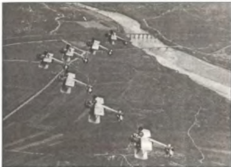
Итальянские пилоты демонстрируют групповой пилотаж над аэродромом Гориция