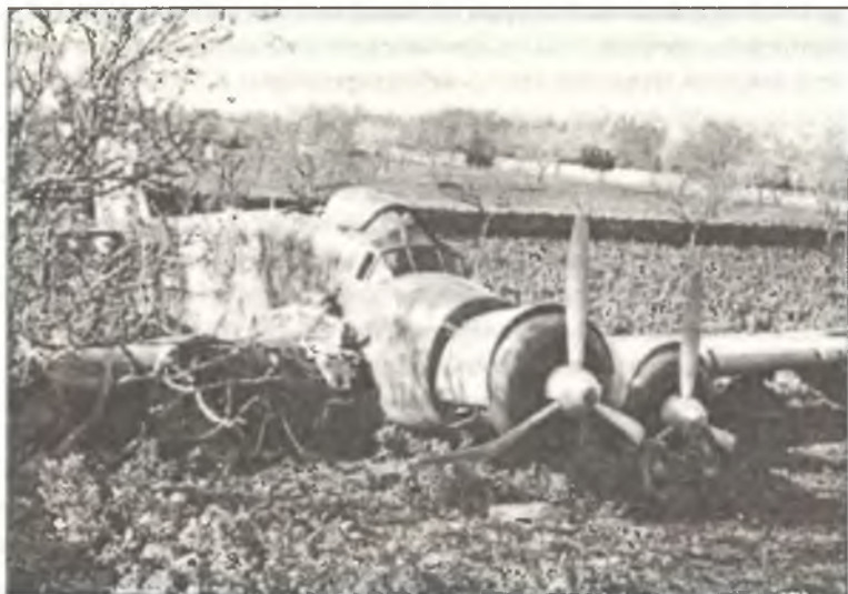
Бомбардировщик SM.79, совершивший вынужденную посадку «на брюхо»