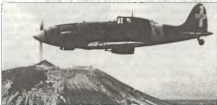
Истребитель С.202 из 22° Gr.Aut. С.Т., сфотографированный над вулканом Везувий на Сицилии, лето 1943 г.