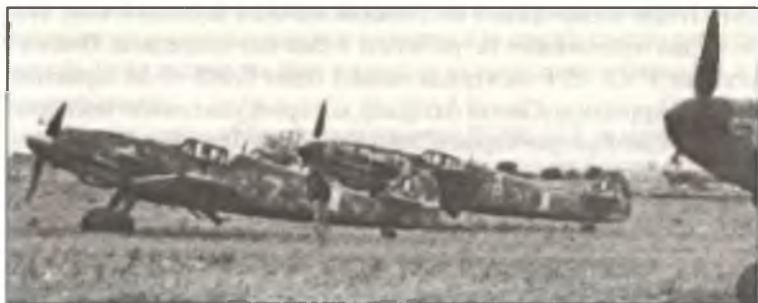
Истребители Bf-109G из 2° Squadr. 11° Gr. С.Т. перед взлетом, аэродром Кашина-Ваджа, июнь 1944 г.