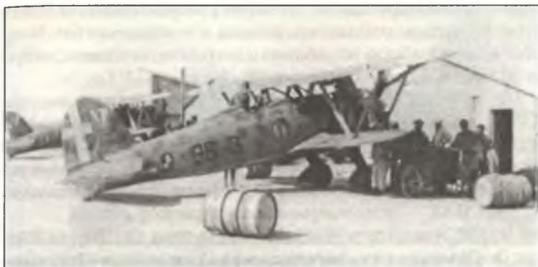
Истребители CR.42 из 96° Squadr. 9° Gr. 4° Stormo C.T., аэродром Эль-Адем, лето 1940 г.