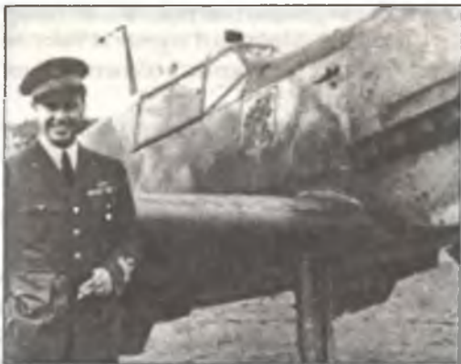
Капитано Никлот Доглио около Bf-109E-4 из II./JG54, Бельгия, осень 1940 г.