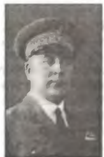
Генерал Франческо Де Пинедо (слева) и колонелло Альдо Пелегрини (справа), руководившие в 1928 — 29 гг. дальними перелетами больших групп гидросамолетов Реджиа Аэронаутики