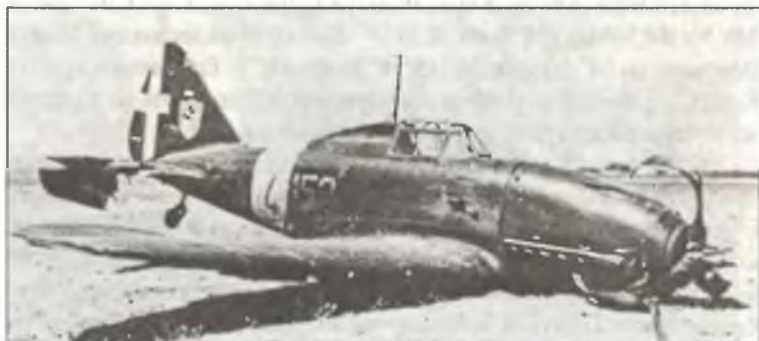
Re.2001 «152 – 4» капитано Сальваторе Тейя (Salvatore Teia) из 152° Squadr. 2° Gr.Aut. С.Т., поврежденный в бою над Мальтой и совершивший вынужденную посадку «на живот» на побережье Сицилии, июнь 1942 г.