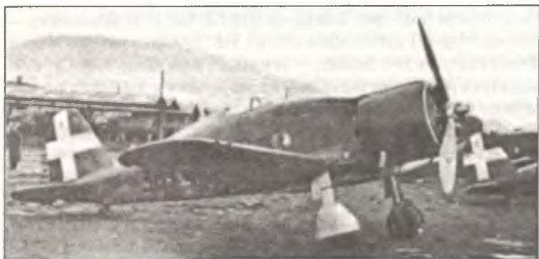
Истребители G.50bis из 154° Gr.Aut. С.Т.: вверху — из 354° Squadr., внизу — из 361° Squadr., Албания, декабрь 1940 г.