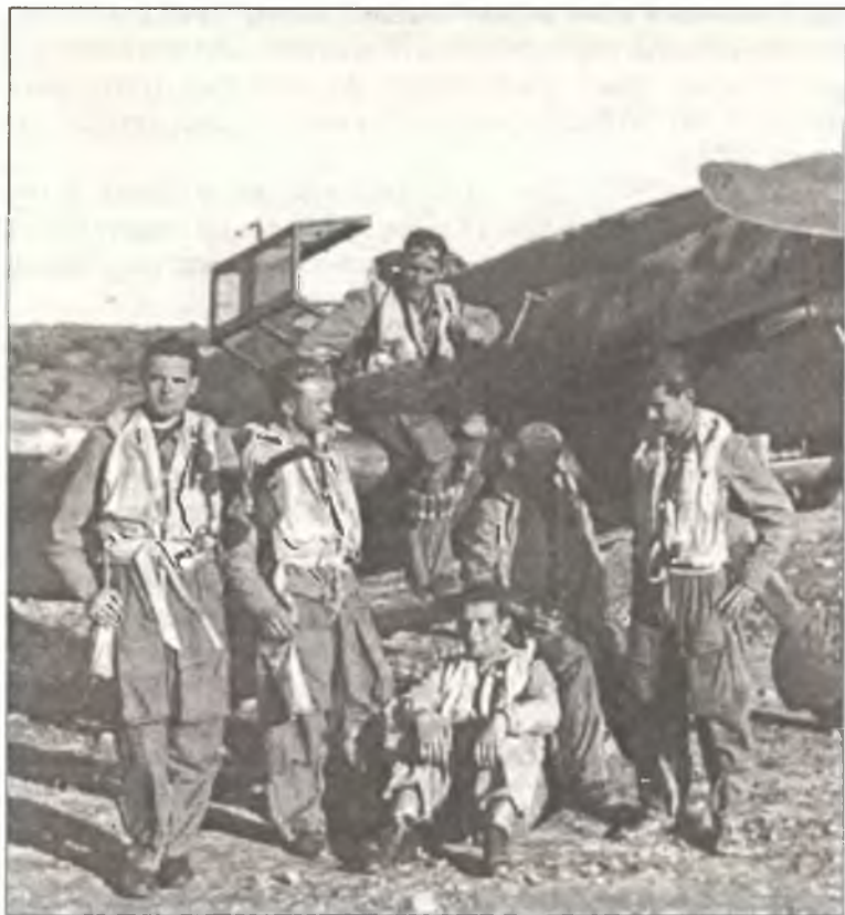
Пилоты 150 o Gr. Aut. С.Т., аэродром Шакка, Сицилия, июнь 1943 г. На крыле «Мессершмитта» сидит командир 363 o Squadr. тененте Уго Драго