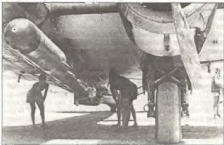
Торпеда под центропланом SM.79, самолет имел узлы подвески для двух торпед, но обычно подвешивалась только одна