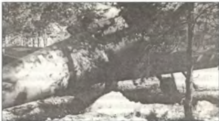
Bf-109G-14 из 2° Squadr. II° Gr. С.Т., аэродром Лонате-Поццоло, январь 1945 г.