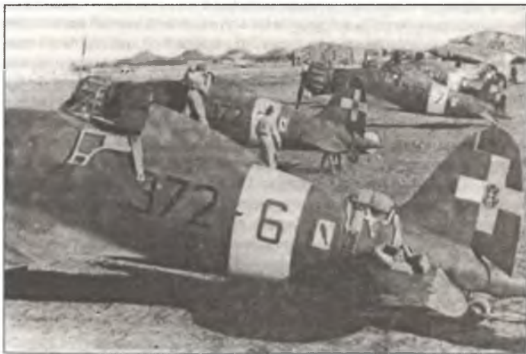
Истребители С.200 из 372 о Squadr. С.Т., Албания, весна 1941 г.