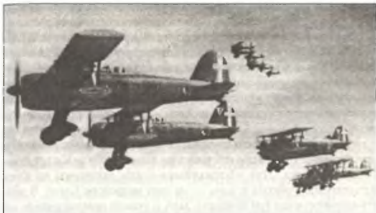
Истребители CR.42 из 9° Gr. 4° Stormo C.T., на переднем плане — самолет командира группы маджоре Ботто, Ливия, лето 1940 г.