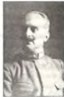
Джулио Дуэ, разработавший теорию воздушной войны на основе использования стратегической бомбардировочной авиации