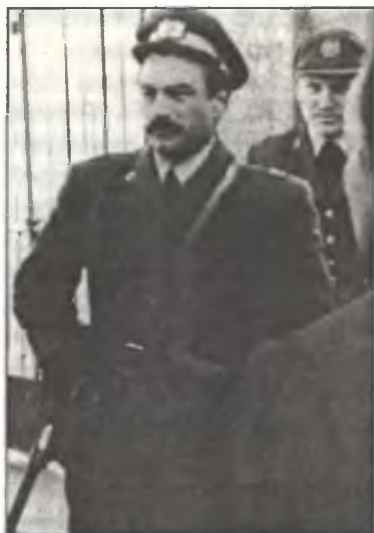
Одна из последних фотографий командира I° Gr. С.Т. маджиоре Адриано Висконти, конец апреля 1945 г.