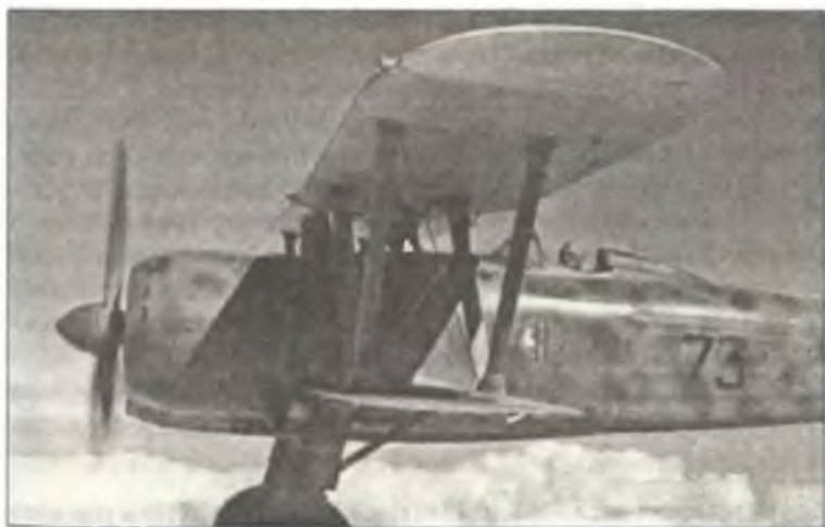
Командир 9° Gr. 4° Stormo C.T. маджоре Эрнесто Ботто в кабине истребителя CR.42 из 73° Squadr., Ливия, лето 1940 г.